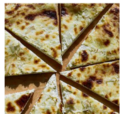
Es gibt auch frischen Rahmkuchen.

Glems. Der Trachtenverein Glems lädt am Sonntag, 30. Juli, zum Hock rund ums Backhaus in der Ortsmitte ein. Beginn ist um 9.30 Uhr mit einem Gottesdienst, der von Pfarrer Ulrich Rapp gehalten wird. Im Anschluss startet dann der Festbetrieb. Der Trachtenverein hat Rote Currywurst, Pommes und Kartoffelspiralen im Angebot. Außerdem gibt es für die